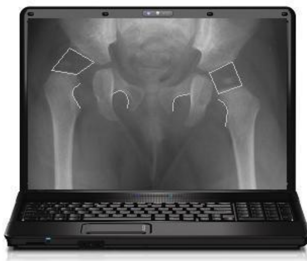
felirat: 1.ábra: Ortopédiai e-tanulás; a veleszületett csípőficam radiológiai jeleinek bemutatása